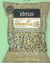
500g / 250g